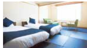
スタンダード和室