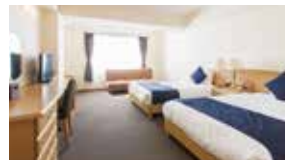
スタンダード洋室